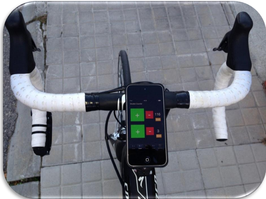
App manual de conteo de adelantamientos y errores